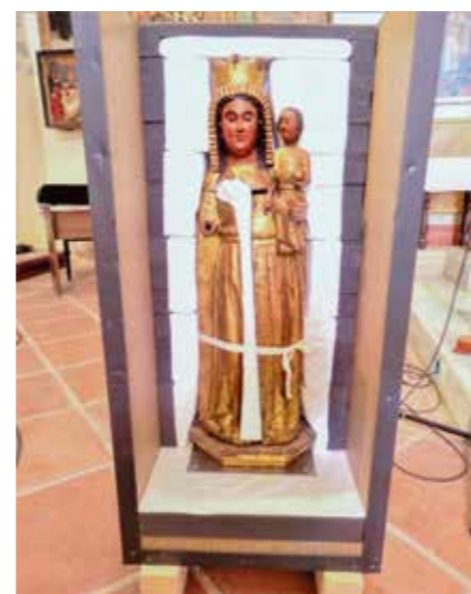
En exposition à Francfort du 4 octobre au 03 mars