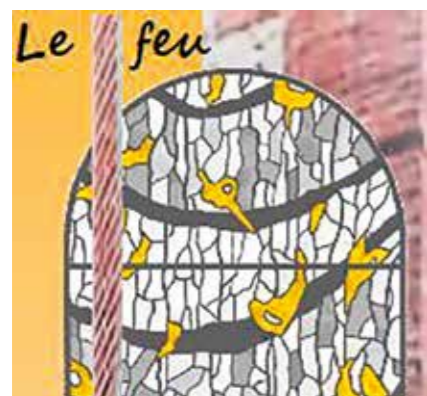
Maquette des prochains vitraux, le feu par Carlo Roccella

D'autre part, l'oculus et l'arcature de chaque face seront physiquement en opposition de l'élément qu'ils regardent. C'est ainsi que nous avons placé l'air aussi intitulé “le vent” face à la tramontane, et que nous placerons le prochain, en cours de souscription, “le feu” face au soleil levant et pour finir “l'eau” fera face au