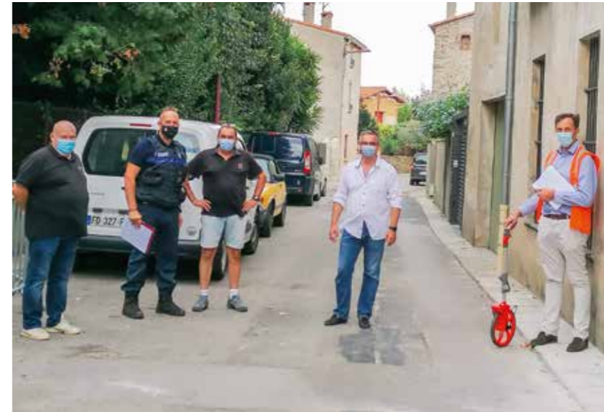
Visite d'étude pour la signalétique et l'aménagement routier

Cette première phase de l'audit va nous permettre de revoir la signalisation et les aménagements routiers afin d'améliorer le stationnement et de diminuer la vitesse pour rendre notre village encore plus agréable et sûr pour ses habitants.