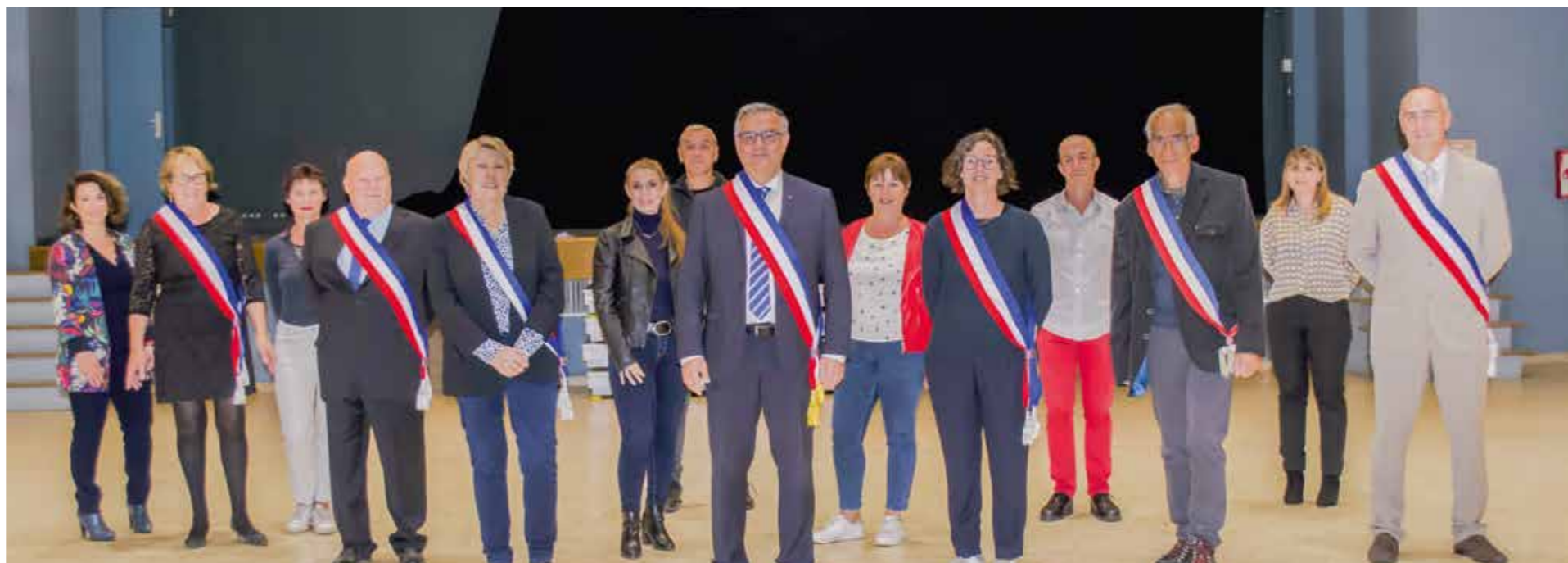
Les distanciations ayant été respectées, les masques ont pu être enlevés.