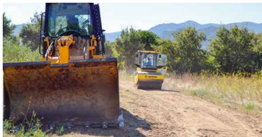
Réfection du chemin Vigne de Villeclare

Une barrière de gabarit sera également posée afin d'interdire les abords du lac aux camping-cars.