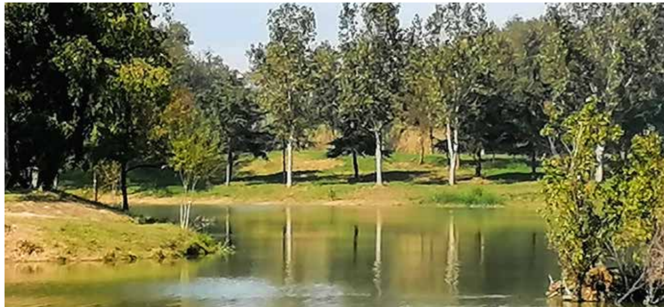
Nettoyage du lac et entretien des pompes

La municipalité s'est attachée à apporter aux Palauenques et Palauencs des aménagements visant à améliorer et embellir leur quotidien. Certains travaux ont déjà débuté.