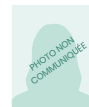
Renée OCAMPO Conseillère Municipale