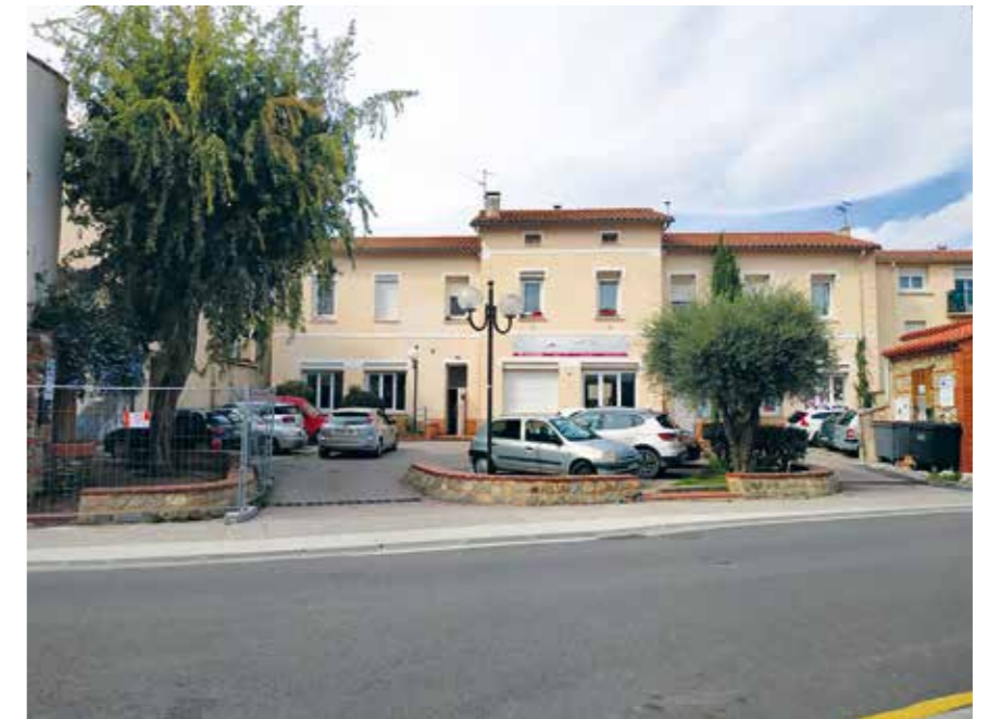
Réaménagement du parking pour gagner des places de stationnement

Les jardinières ont été enlevées pour recréer des places de stationnement supplémentaires à durée limitée auprès des commerces Cano, Thellier et la Dolce Vita.