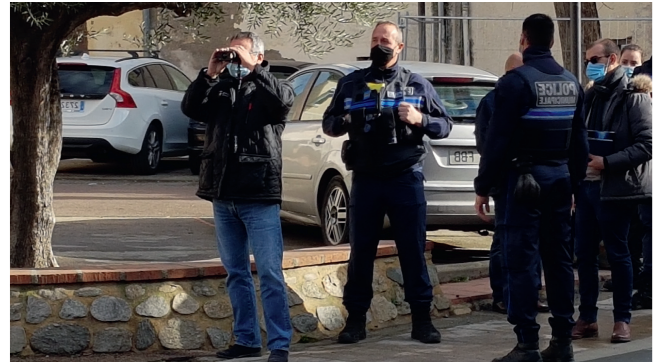
Monsieur le Maire teste le radar