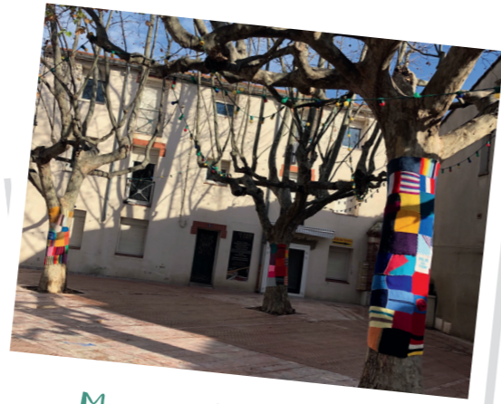
Merci aux tricoteuses !