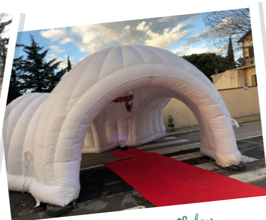
L'igloo de Monsieur Choley

La publication de ces photos a été faite avec l'autorisation des parents. Nous remercions Monsieur CHOLEY pour l'igloo positionné à l'entrée de l'école pour le plus grand bonheur des enfants.