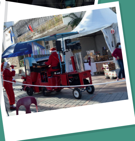
Des animations pour petits et grands!