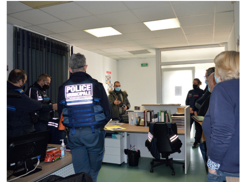
Présentation du cinémomètre laser

Ceci nous permettra de mettre en place des contrôles de prévention dans un premier temps qui seront suivis par des contrôles réguliers avec verbalisation si nécessaire.