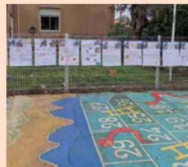
Exposition dans la cours de récréation de l'école Jules Verne. Présentation des différents programmes de campagne réalisés en binôme fille/garçon.

Le 30 mars, le Maire a procédé à l'installation du Conseil Municipal des Enfants accompagné du comité