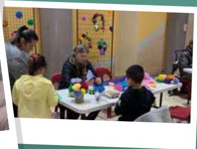
Ateliers décoratifs, mojitos et jus de fruits ont satisfait les visiteurs.