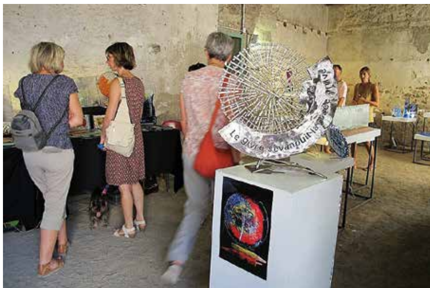
Exposition durant l'été verrier

« Ville et métiers d'art » est une vaste association qui regroupe plus de 600 communes qui ont fait le choix de favoriser l'installation de professionnels des métiers d'art et de la transmission des savoir-faire d'exception, de développer le tourisme culturel, d'agir auprès des publics scolaires et d'accompagner les actions de formation.