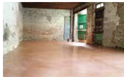
Coulage de la chape à la maison Vila pour une nouvelle boutique éphémère

premier lieu, les artisans verriers locaux afin que Palau del Vidre devienne l'épicentre verrier du Roussillon.