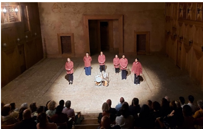
Théâtre de l'Épée de Bois, Cartoucherie de Vincennes

https://www.rfi.fr/fr/podcasts/reportage-france/20211123-le-grand-large-une-pièce-qui-parle-des-violences-faites-aux-femmes