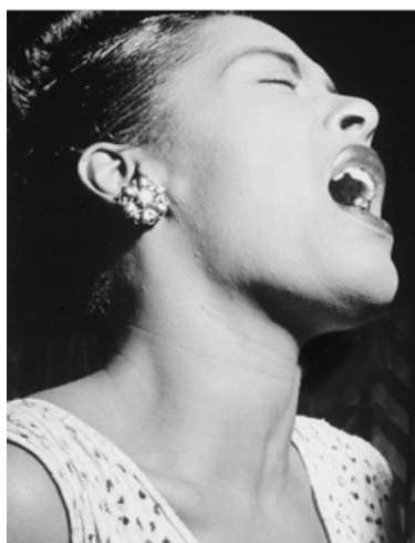
Billie Holiday